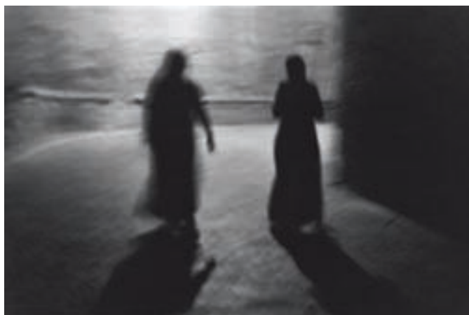
Photo & Cie Bernard Plossu, Valérie Gondran, Michel Castermans, Jacques Camborde Galerie HorsChamp, place de l'église Du 29 octobre au 19 décembre 2010 Les vendredis, samedis et dimanches de 14h à 19h

Cette exposition est le fruit d'une rencontre entre quatre photographes qui ont pris l'habitude de voyager souvent ensemble, en faisant des photos. Alchimie d'une rencontre exceptionnelle en Ardèche catalysée par le regard professionnel de l'un, le désir de progresser des autres, et surtout, pour tous, par le plaisir de ces marches vagabondes au gré des images sans cesse renouvelées et multipliées par les regards croisés au travers des objectifs. Du Massif Central à l'arrière-pays Toscan, de Palerme aux Pyrénées nous nous retrouvons souvent comme une véritable famille, et faisons ensemble des photos que nous nous montrons après, bien sûr !