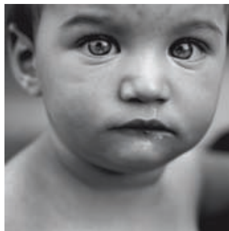
Faccia quadrata Alessandro Villa Jusqu'au 24 octobre 2010