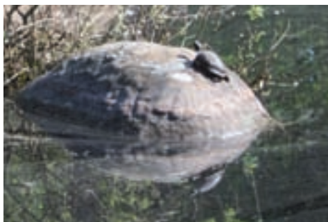
Balade du mardi pour la tortue de la Mare aux Pigeons

Chaque mardi matin, balade de 2h/2h30 pour "moyen marcheur" - RDV à 8h30/8h45 au Mail de la Belle-Allée