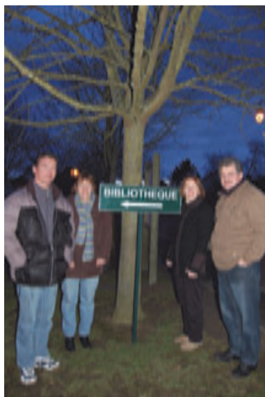
L'équipe de la bibliothèque

A partir du mois de mars nous lirons un conte tous les mois pour les enfants, le programme sera affiché à la bibliothèque. Toujours pour les enfants, nous organisons un concours de masques de carnaval le lundi 2 mars, un jury récompensera le plus beau masque le lundi 9 mars.