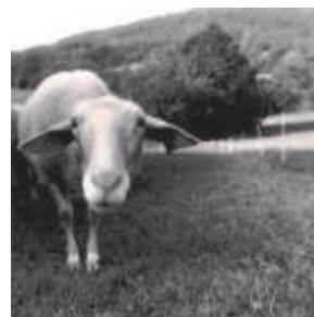
Alain Gillet - Brebis...