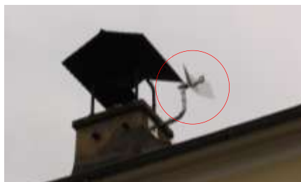
Votre antenne de réception

part de Melun, passe par l'église de Sivry et le château d'eau de Courtry pour enfin rejoindre votre domicile où, cette fois par un câble Ethernet, vous pourrez relier votre ordinateur.